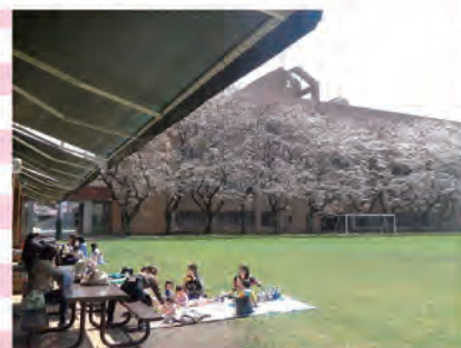
自然豊かなキャンパスで季節を感じて