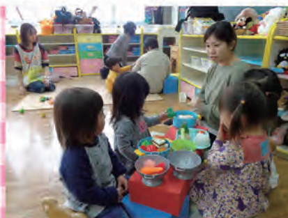
子ども同士のやりとりも自然に生まれます