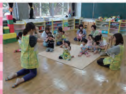
+ママの手遊びや読み聞かせを楽しむ時間も