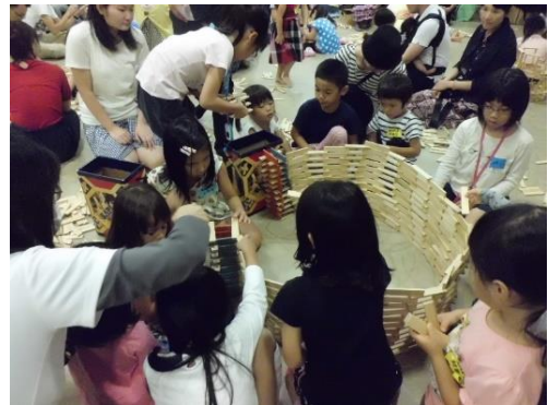
COO（カプラブロックワークショップ）