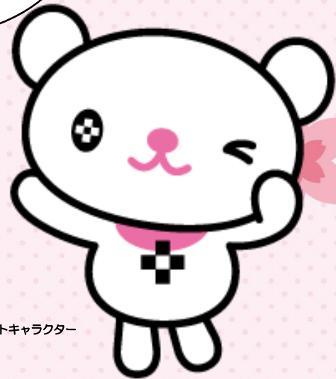
本学マスコットキャラクター プラスちゃん