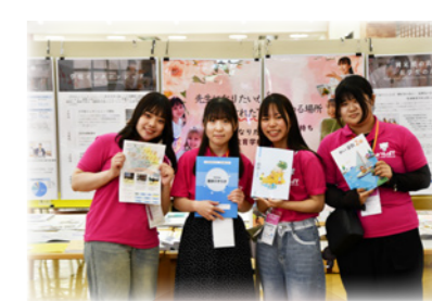
学生と話せる学科展示 12:30 ~ 16:20

総合型選抜の概要や、合格に向けた ポイントを解説します。 5~8月の限定プログラムですので お聞き逃しなく！