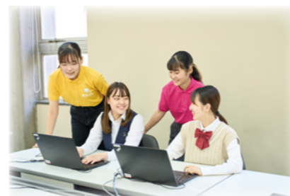
体験講座 13:45 ~ 14:25

大学の授業と同じ形式で進行するため、 入学後の学びをイメージすることが出来ます。 毎回異なる内容で実施しているので、初めて オープンキャンパスに来場する方はもちろん、 複数回来場されている方も是非ご参加ください！