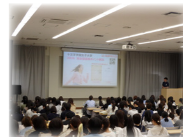
総合型選抜ポイント解説 14:40 ~ 15:15

大学の授業と同じ形式で進行するため、 入学後の学びをイメージすることが出来ます。 毎回異なる内容で実施しているので、初めて オープンキャンパスに来場する方はもちろん、 複数回来場されている方も是非ご参加ください！