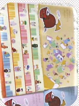
もっくんグッズカバ-