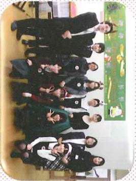
クリスマスコンサート