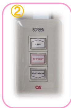
壁面スクリーンスイッチ