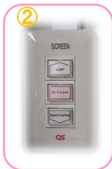
壁面スクリーンスイッチ