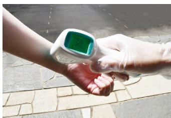
手首での検温（正門）