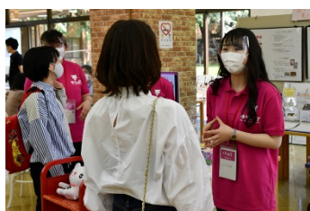
マスク・フェイスシールドの着用