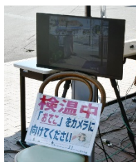
モニターによる検温（正門）