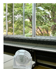
会場内の換気 (窓の開放・サーキュレーターによる空気の循環)