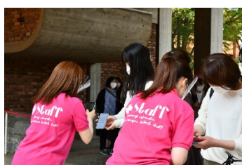
受付でのQRコード読み取り