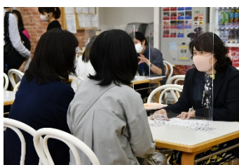
飛沫防止ボードの設置（個別相談）